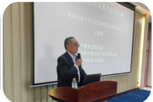
Prof. Zhang Xizhen ได้รับเชิญให้เป็นอาจารย์พิเศษและแนะแนวเกี่ยวกับทุนแลกเปลี่ยนให้กับนักศึกษา ที่มหาวิทยาลัยในประเทศจีน ระหว่างวันที่ 6 - 15 ธันวาคม 2568